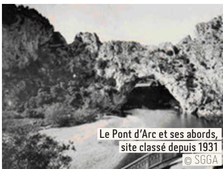
Le Pont d'Arc et ses abords, site classé depuis 1931

La France est connue pour la beauté et la diversité de ses paysages. Les plus beaux sont reconnus et protégés en tant que « sites classés » et constituent le patrimoine national. C'est pour restaurer, préserver, gérer et mettre en valeur certains de ces sites classés, parmi les plus touristiques, emblématiques, mais fragiles, que des collectivités se sont engagées dans une démarche Grand Site de France. Le territoire de projet peut toutefois s'étendre au-delà du site protégé.