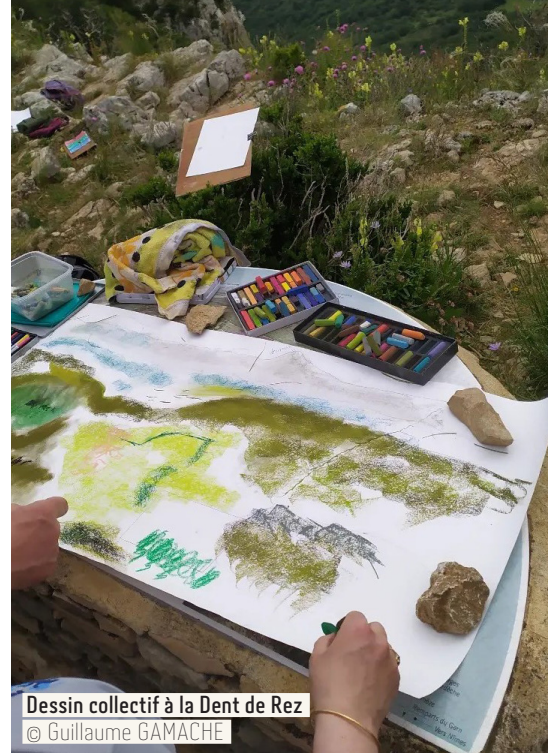
Dessin collectif à la Dent de Rez